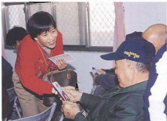
議 長 的 話

昭玲身為婦女，深知兩性平權及照顧弱勢團體的重要性，因此未來不僅繼續爭取婦女及弱勢團體福利之外，也希望