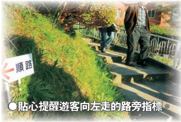
● 貼心提醒遊客向左走的路旁指標。

與驚奇。這些看似微不足道的日常用品設計，提供了我們各種生活上的 便利性，這些意想不到的設計，將平凡的生活中製造出讓人們深刻的貼 心與感動。