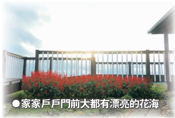
● 家家戶戶門前大都有漂亮的花海。