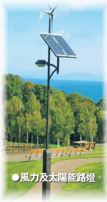
● 風力及太陽能路燈。