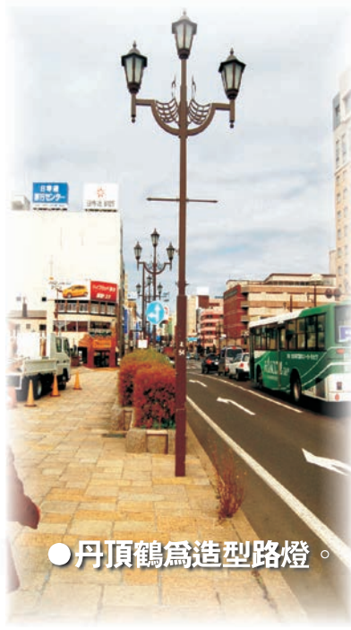
● 丹頂鶴為造型路燈。