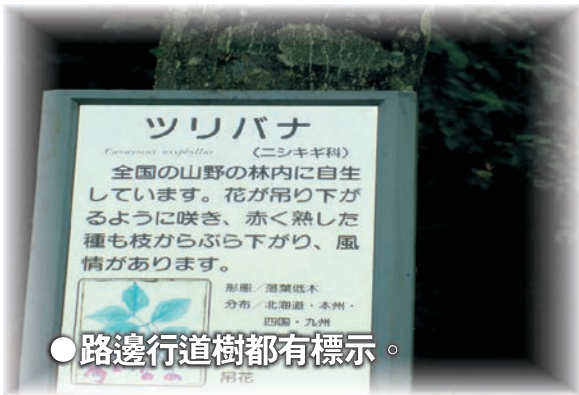
● 路邊行道樹都有標示。