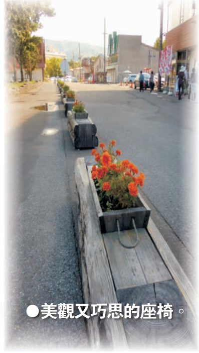
● 美觀又巧思的座椅。

間頻繁更迭，必造成政局不穩，國民豈能安居樂業，對比於此，相對在台灣的我們應當更加惜福，日本雖有諸多長處，但也不全然都是優點需要學習，這可從目前的社會看出一般，日本文化規矩禁忌多，一切有他們自己的遊戲規則，形成各類大大小小的封閉圈，外國人要打進融入日本人的生活，真的難上加難，年長的父母和已成年的孩子在外用餐，須自掏腰包，各自付帳，這在我們台灣社會是無法見容的，必受責難，但是他們卻習以為常，儼然是日常生活的一部分，這就是文化不同，造成不同的生活習慣和價值觀，這在澎湖推行孝順年的我們聽起來，心中別有一番滋味。再來是日圓升值，外國觀光客想要購物的慾望在實際看到物品的價碼牌也不得不縮手，因為各項產品的價格高漲，甚至有同樣的產品回到台灣再買的聲音出現，物品價格令遊客裹足不前，這樣的情況是否也連帶的影響日本百貨商家的生意呢？在沿途我們詳細的聽，努力的看，也一一對比之下，在揮別北海道，回到台灣的懷抱之際，我們不得不承認身為台灣人是相對幸福的。