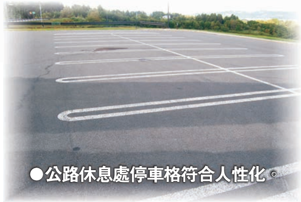
● 公路休息處停車格符合人性化。