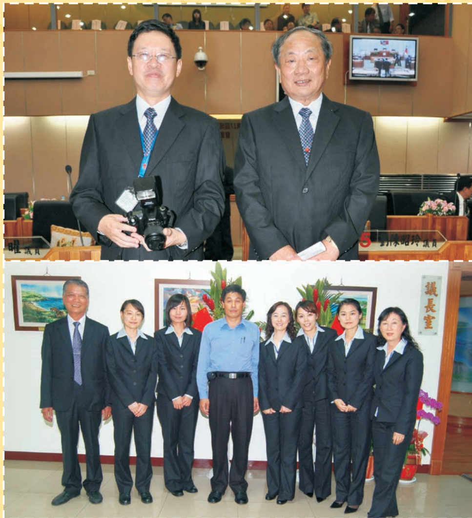
澎湖縣議會第17屆成立大會辦理議員宣誓就職典禮暨議長副議長選舉

■ 歡樂的氣氛充滿著澎湖縣議會各角落，完成第十七屆就職典禮後，大家開心合影留念。