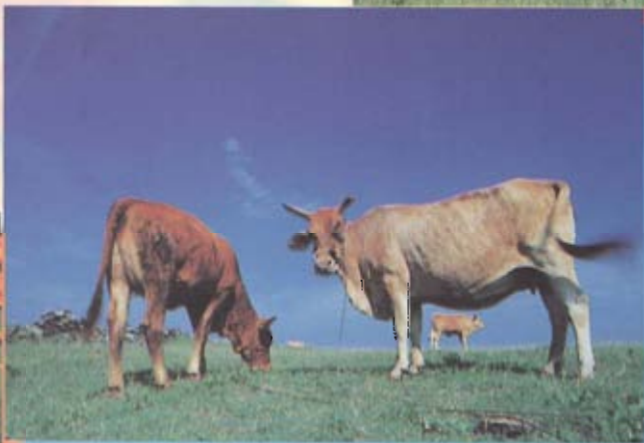
入選／田野風光／洪明景