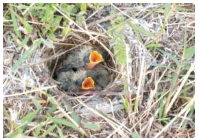
■ 小雲雀孵化後的第4天

澎湖縣的地理環境比較特殊，有許多空曠的地方，不像台灣本島有許多樹木，而小雲雀就是喜歡在空曠地方鳴唱，每年春夏都會來到澎湖的鄉下，到處都可以聽到小雲雀悅耳的歌聲，所以牠在澎湖很具有代表性，因而在澎湖舉辦的縣鳥票選中脫穎而出，以最高票當選為澎湖縣的縣鳥。