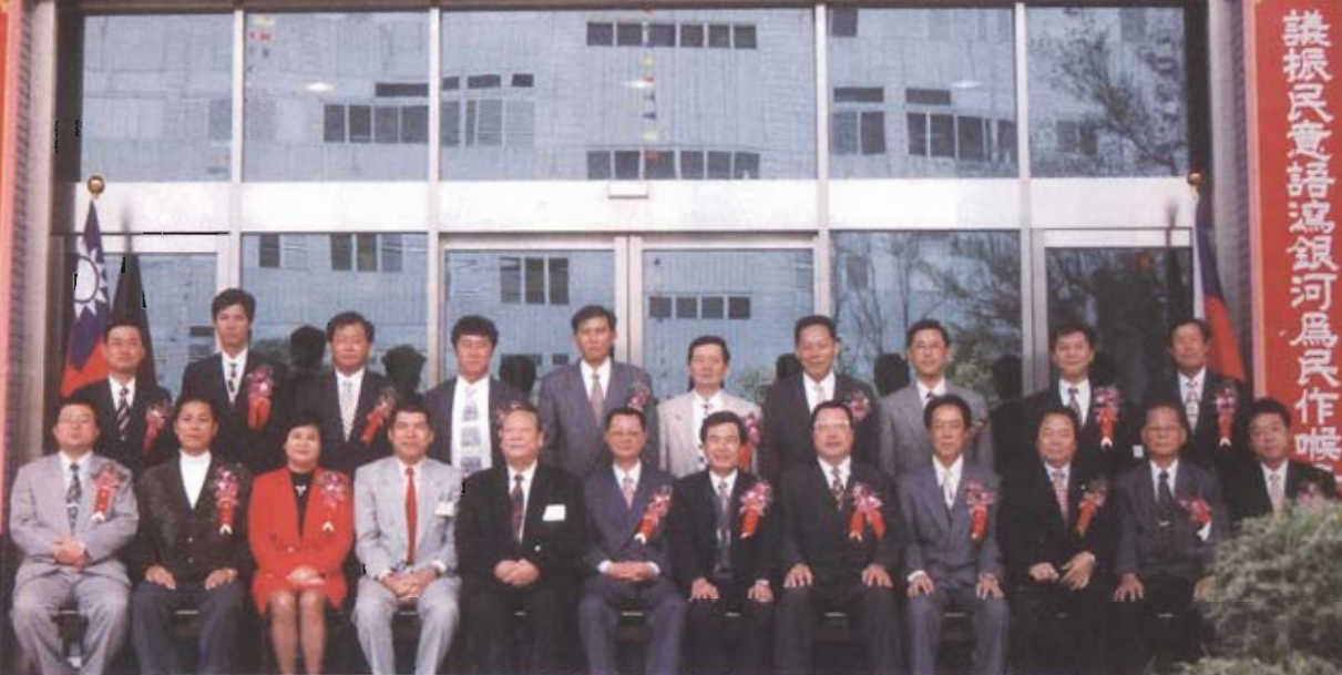
○ 第十四屆十九席議員宣誓就職並選舉議長、副議長後合影留念。