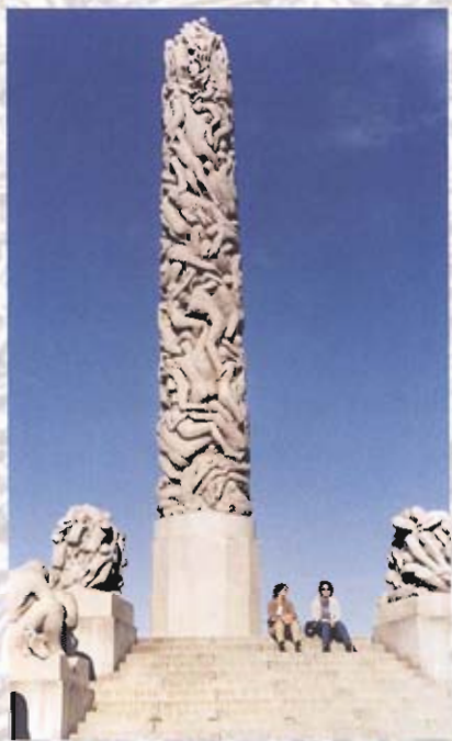
○ 挪威首都奧斯陸的人文標竿福洛格納雕刻大公園內生命之輪中心的巨石柱