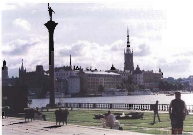
○ 市政府緊臨著梅拉倫湖：典型的湖海城市

在這裡，我們參觀了位於君古斯赫爾門島上的市政廳。從市區任何一個角落都可以看見市政廳高樓突出地平線上，在塔樓上有個閃耀著象徵瑞典和斯德哥爾摩的三王冠。它的建築融合了萊克城堡 (Lacko Castle) 的特色和藍廳 (Blue Hall) 的列柱與大樓梯。藍廳的建築深受威尼斯總督府 (Doge's Palace) 的影響。市政廳南側面對梅拉倫湖的開放門廊靈感亦來自威尼斯。看完了諾貝爾頒獎大典的大禮堂：藍廳，再看據稱由一千九百萬片鍍金箔的馬賽克瓷磚所完成的金廳，我們回到斯德哥爾摩歷史的起點：舊城，它迄今仍是一座中古城市的外觀，其狹窄的巷弄曲曲折折地伸展者。我們不時可以發現這裡的人在整修房屋或旅店時無不刻意將古堡牆壁或早期