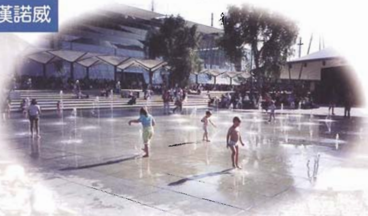
◎德國漢諾威「人類、自然、科技」主題博覽會溫馨自然的親子噴水池

抵達首站德國北部的工業大城－漢諾威市已是九日上午十點時分，漢諾威是德國十六個州之一下薩克森州（Lower Saxony）的首府，人口約五十餘萬，是二次世界大戰時德國的工業重鎮之一，舉凡汽車製造業、輕工業及糖果製造業，皆