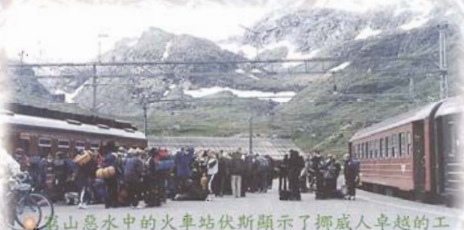
窮山惡水中的火車站伏斯顯示了挪威人卓越的工程技術 (奧斯陸與卑爾根之間)

賀美科侖 (Holmen Kollen) 滑雪跳台位於奧斯陸的近郊，挪威冬季運動會的一個重要場地。理論上，它應該屬於冬天的。但當我們在八月份的現在，來到了