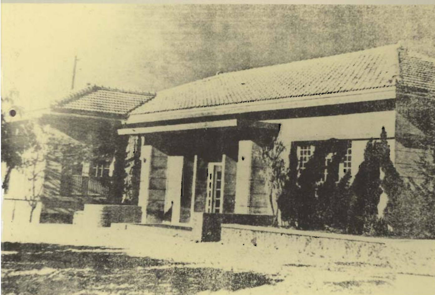
● 圖為民國二十二年由日本人建造的馬公街會館（馬公支廳轄管），民國三十九年十月二十七日第一屆議會成立遷入辦公，民國五十年該館拆除重建