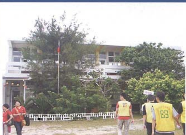
白沙鄉大倉國民小學走入歷史

在與受訪者進行訪談後整理出如下相關結論，並據以提出對於中央政府、地方政府與社區村里的建議，供作本縣裁撤後之校地再利用之參考。