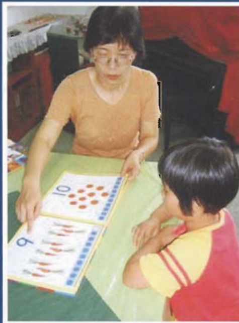
規劃符合社區需求發展再利用計畫