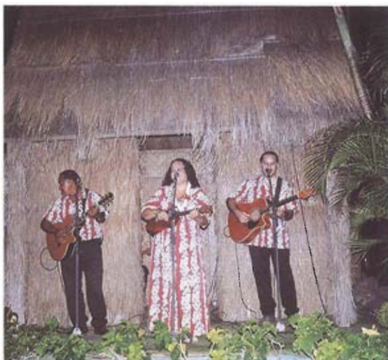
▲ 夏威夷玻里尼西亞人著傳統服飾音樂演奏

澎湖雖號稱發展歷史早於台灣本島，保存較多的中原古風，但卻缺乏主體的民俗文化村，雖然澎湖不像夏威夷為民族的熔爐，並有原住民文化特色，但澎湖傳統的擲筊乞龜、雞母狗、卍字笠、二炭傳香，甚至貝殼項鍊製作、文石研磨及蹴海、巡瀾、潮間帶活動等，都具有地方文化特色，整體規劃成民俗文化村的内容，行程設計能讓遊客吃喝玩樂一整天為主，同時享用澎湖風味餐，雖然西嶼二崁聚落已略具雛型，但卻缺乏相關的行銷，若能整體進行規劃，並將腹地擴大，充分運用海洋特色的賣點，加入音樂及舞蹈，就能創造澎湖特色，帶動觀光發展，並促進地方繁榮；同時為讓漁業生生不息，民俗村附近海域應劃為特定漁業保護區，冬季觀光淡季讓魚兒休養生息，才能創造更多的觀光資源。