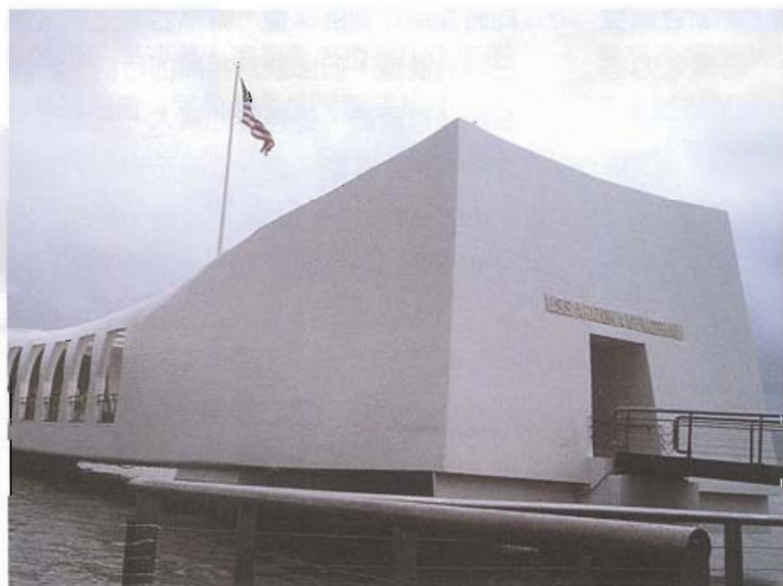
▲ 著名的珍珠港室內戰爭博物館

就是地方特色，響叮噹、簡而明瞭的一句口號，就能代表夏威夷的象徵，說明有特色的地方產業，與發展觀光有密不可分的關係，澎湖雖有蘆薈、仙人掌及風茹草、天人菊及麵線等特色產物，但都缺乏包裝，不要說比不上夏威夷，連金門都望之不如，試比較澎湖的花生糖與金門貢糖，不需贅述、優劣立判；近年來欣見國立澎湖技術學院及澎湖縣農會投入研發工作，