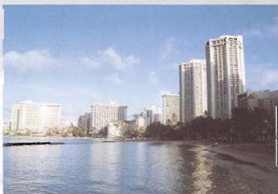
▲ 美麗的威基基海灘

走訪過夏威夷，反觀澎湖群島，雖然號稱為保存中原古風、開發歷史較早的縣市，並為歷史知名的古戰場，同時沙灘、玄武岩等自然美景不遜於夏威夷群島，但