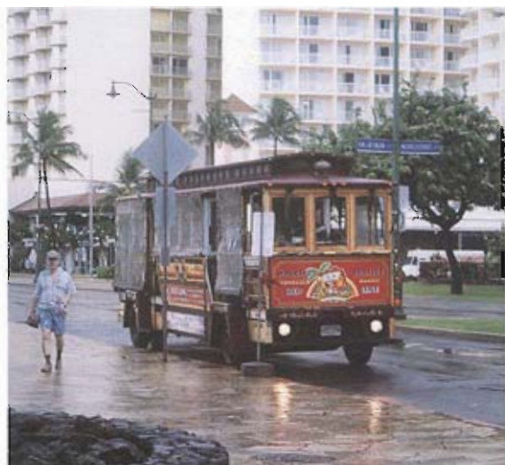
▲ 夏威夷市區街道處處可見的噹噹車

就是地方特色，響叮噹、簡而明瞭的一句口號，就能代表夏威夷的象徵，說明有特色的地方產業，與發展觀光有密不可分的關係，澎湖雖有蘆薈、仙人掌及風茹草、天人菊及麵線等特色產物，但都缺乏包裝，不要說比不上夏威夷，連金門都望之不如，試比較澎湖的花生糖與金門貢糖，不需贅述、優劣立判；近年來欣見國立澎湖技術學院及澎湖縣農會投入研發工作，