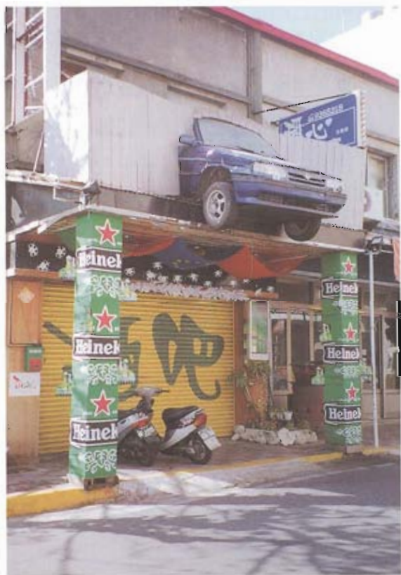
▲ 廣告之出奇招，連汽車都可爬上二樓，有震撼之效果。

總之，觀光作為在於求新求變，但不是採取革命的激烈手段，而是以「人文內涵加上精美包裝、自然生態賦予永續人工」，創造出不同往日的新穎景觀色彩，讓人彷彿踏上有別一般平凡生活的樂趣。如果，澎湖公私部門皆以此為營造概念，當造街已使澎湖街道煥發新氣象、青青草園已點綴出澎湖綠美化的優質環境，以大船作造型的漁產品直銷中心開幕在即，業者又可以為來澎的遊客提供怎樣的驚喜呢？！