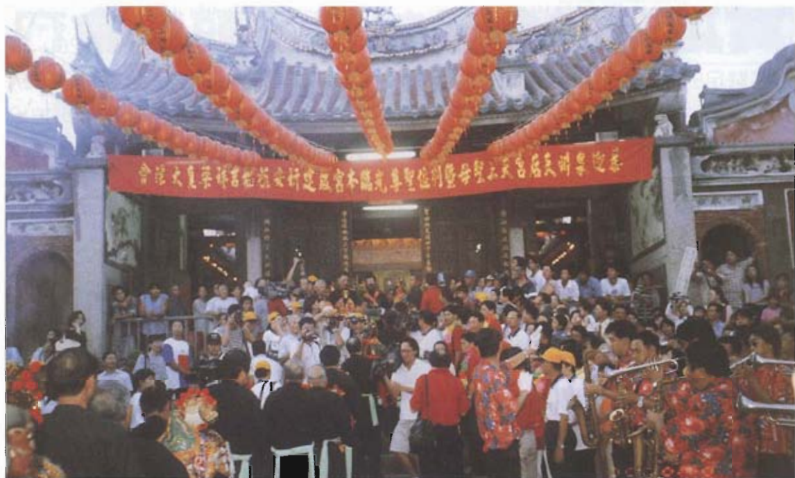
▲ 天后宮是澎湖文化的寶藏，觀光資源豐富，可以再加強行銷。

最重要的是，澎湖如果有一座大樓圍繞的廣場，冬天可以不是那麼冷，甚至冬陽照射下，還特別有一點溫暖的感覺，義大利的康波廣場即是一座依著地形緩降的建築體，遊客在宛如貝殼般的扇形廣場或坐或躺，曬著冬陽渡過悠閒的時光。澎湖人沒有一座真正有地方特色的廣場，一直是城市人心無法交流的死角，夏天如此，冬天更形嚴重。