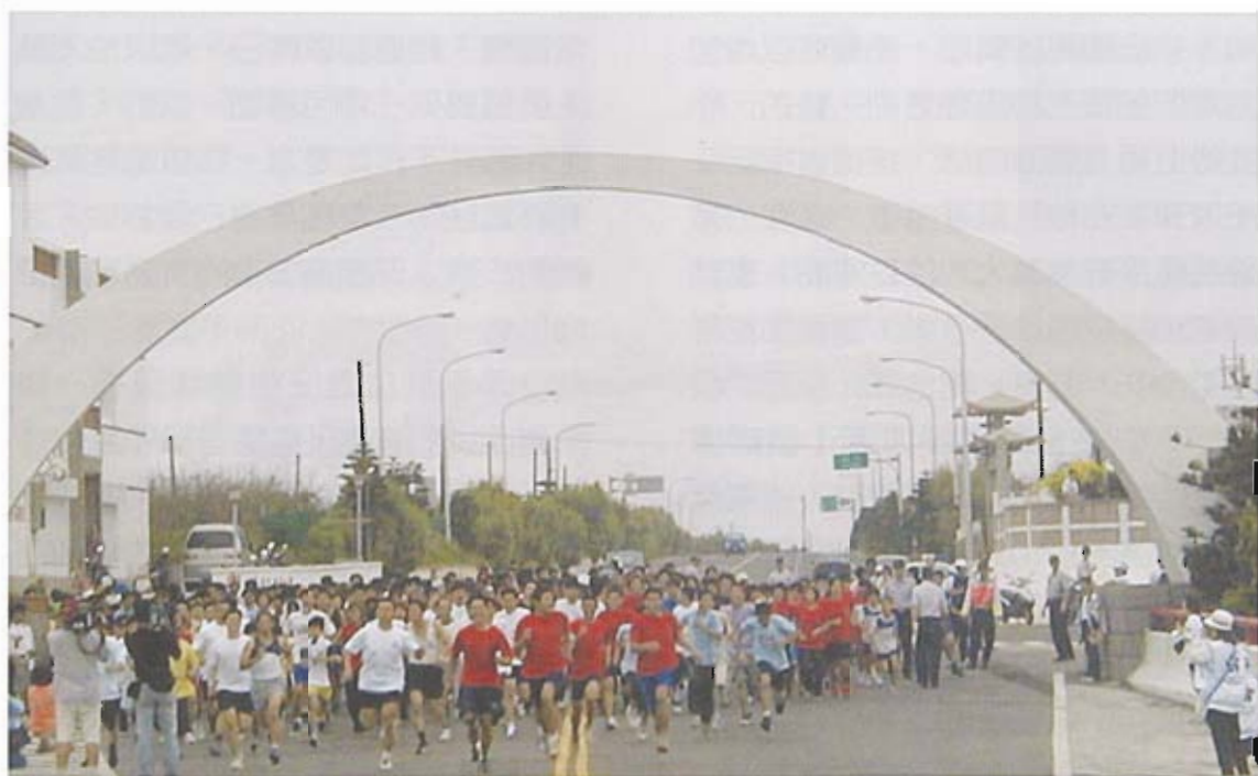
▲ 跨海大橋路跑在冬季舉辦，挑戰風力也挑戰體力，可以長期多方向推廣。

事實上，廣場除了是人潮聚集、發展傳統市場和特色精品街之外，最重要是匯集人氣、思想交流、遊客駐足的多功能的公共設施。在澎湖，廣場的意義可能更勝一籌，因為冬天東北季風強烈，任何形式的戶外活動都非常困難，廣場將或多或少減少這方面發展的艱困。畢竟，廣場如果真的可以匯集人氣，什麼樣的可能不會發生？！