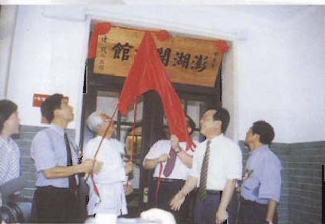
▲澎湖開拓館揭牌，由地方耆宿、中央與地方主管共同拉下紅布，以示隆重。