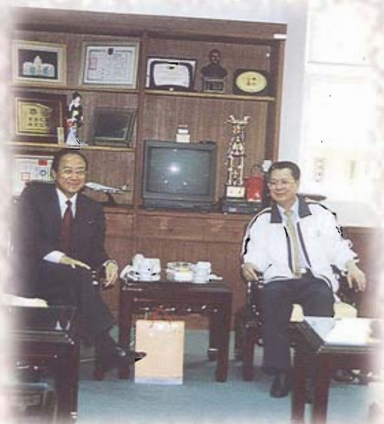
考試院副院長關中蒞會參訪