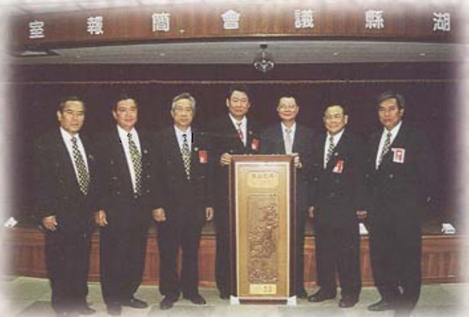
高雄澎湖同鄉會莊理事長率同理監事蒞會參訪