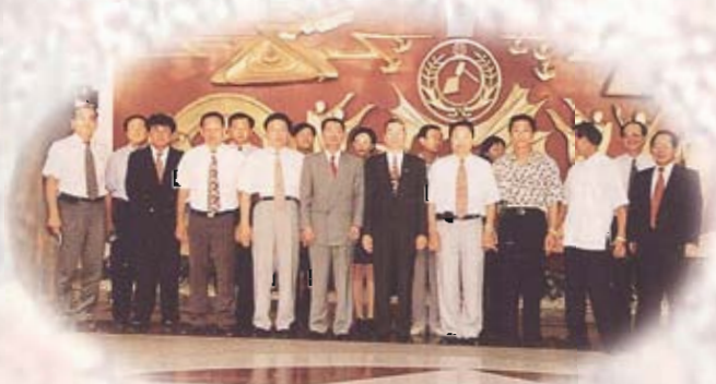
全體議員於台北縣議會參訪合影