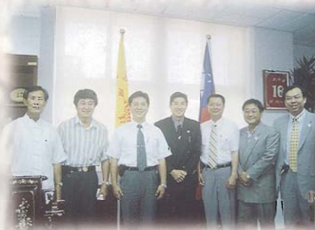
美國夏威夷州眾議員JERRY L. CHANG 蒞會參訪