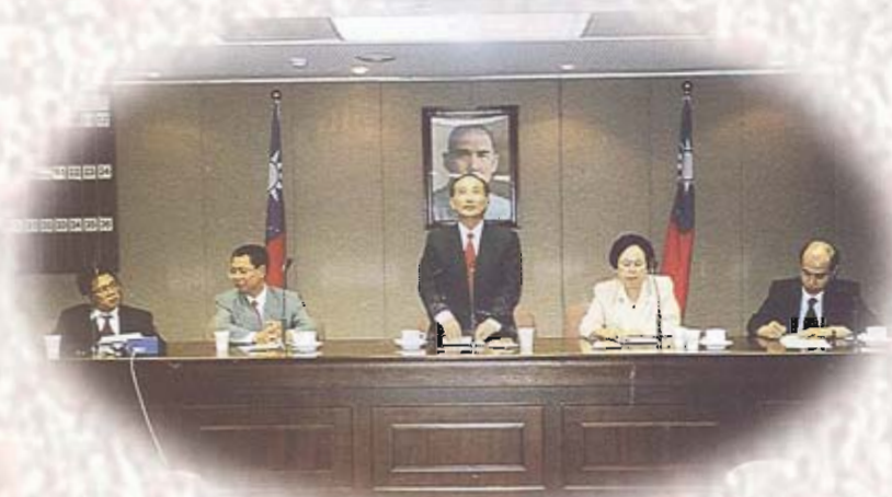
立法院長王金平召開說明會

八十八年六月十日蘇議長崑雄率全體議員赴立法院爭取離島建設條例早日立法，由王金平院長接見並召開說明會