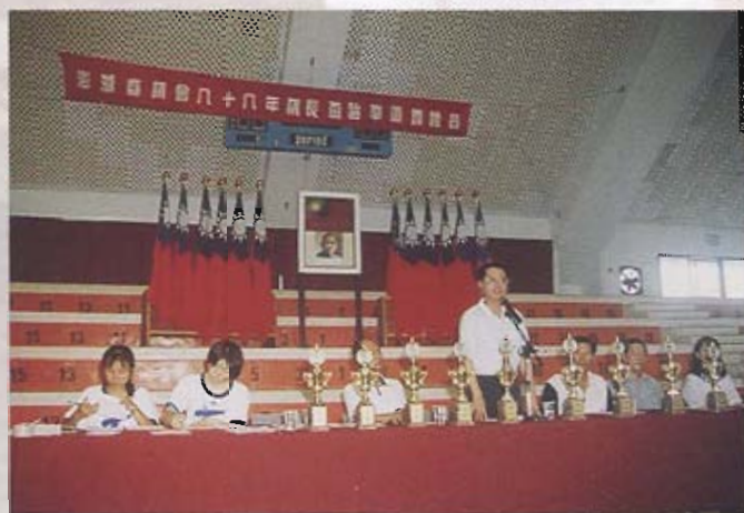
議長蘇崑雄勉勵選手更上一層樓

八十八年議長盃跆拳道錦標賽於六月十九日在縣立體育館隆重揭幕；擔任本縣跆拳道協會主任委員的議長蘇崑雄在看到本縣跆拳道運動風氣日熾甚表高興，他在致詞時特別勉勵每一位運動員要精益求精，更上一層樓，讓澎湖縣的選手能進軍國內跆拳道界，以佔有一席之地。