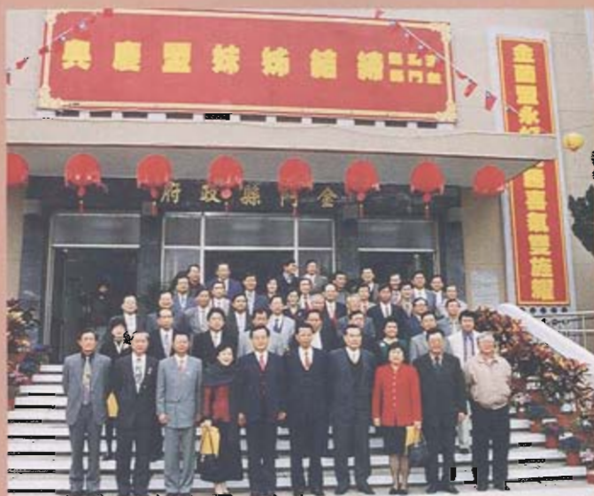
八十八年三月十日本縣與金門締結姊妹縣。