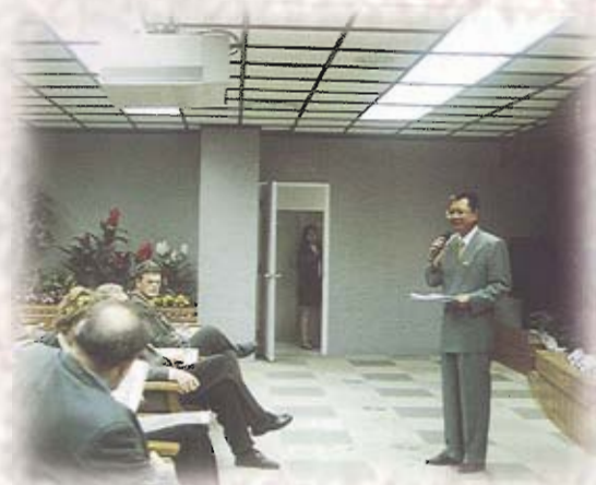
冰島訪問團蒞會參訪