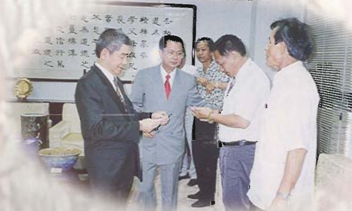
議長率全體議員赴台北縣議會拜會，由許議長接見並致贈紀念品