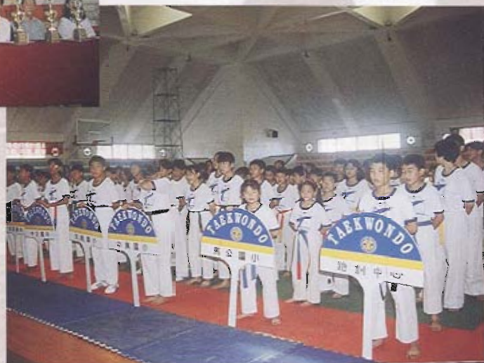
比賽隊伍陣容整齊，精神抖擻