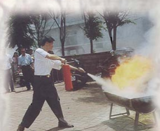
左、右圖：本會員工認真練習使用滅火器