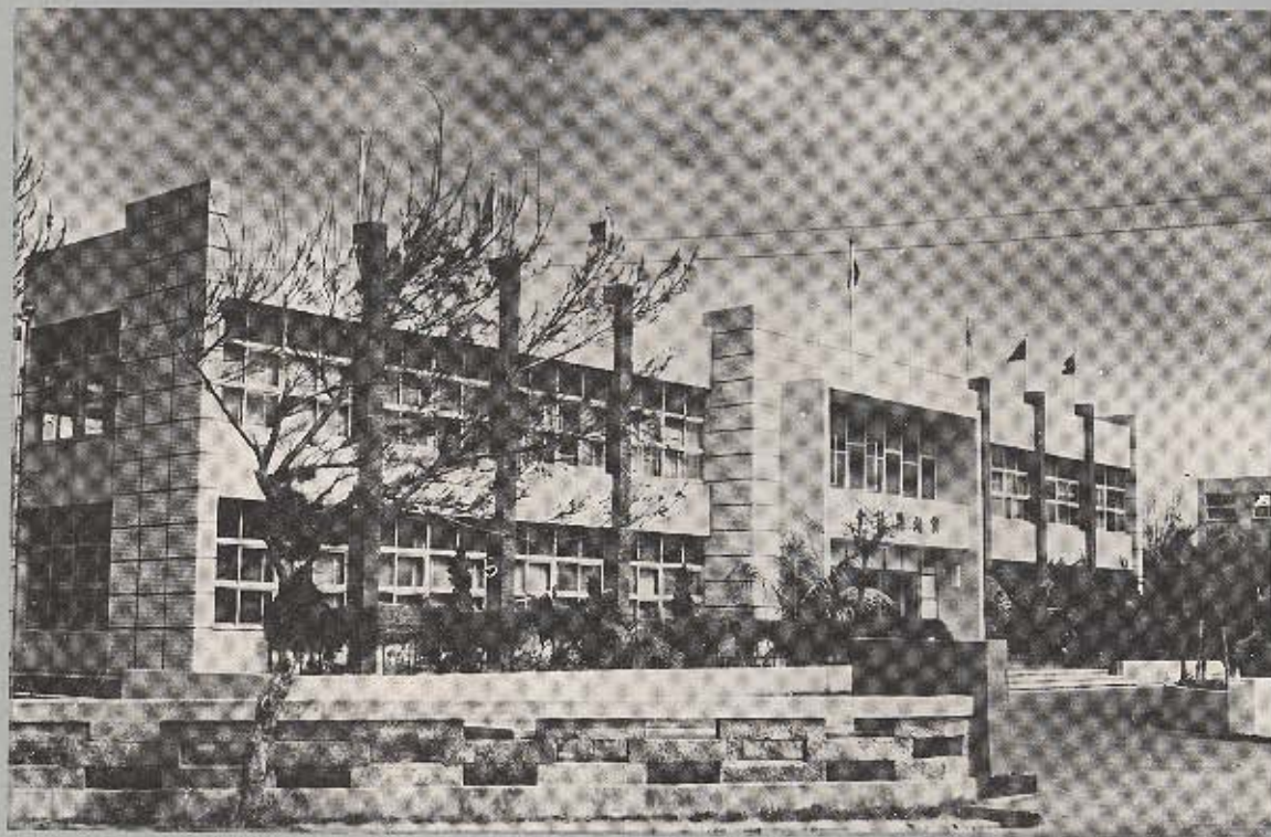
澎湖縣會議大會樓