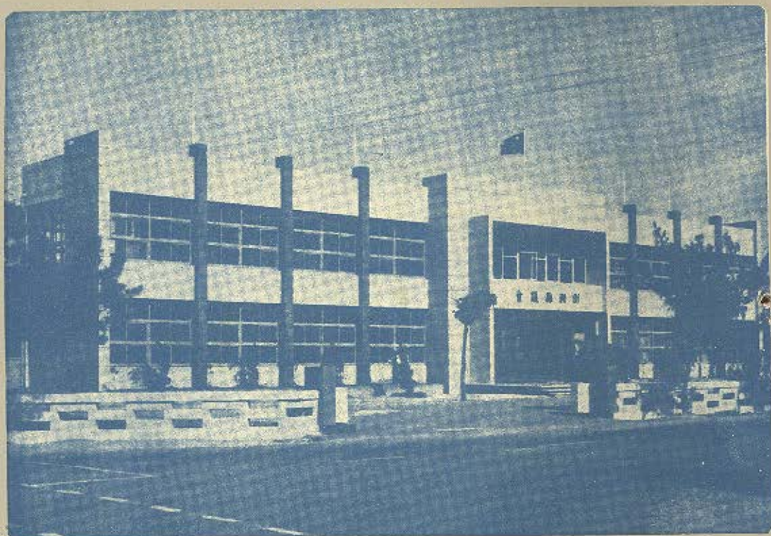
澎湖縣會議會大樓