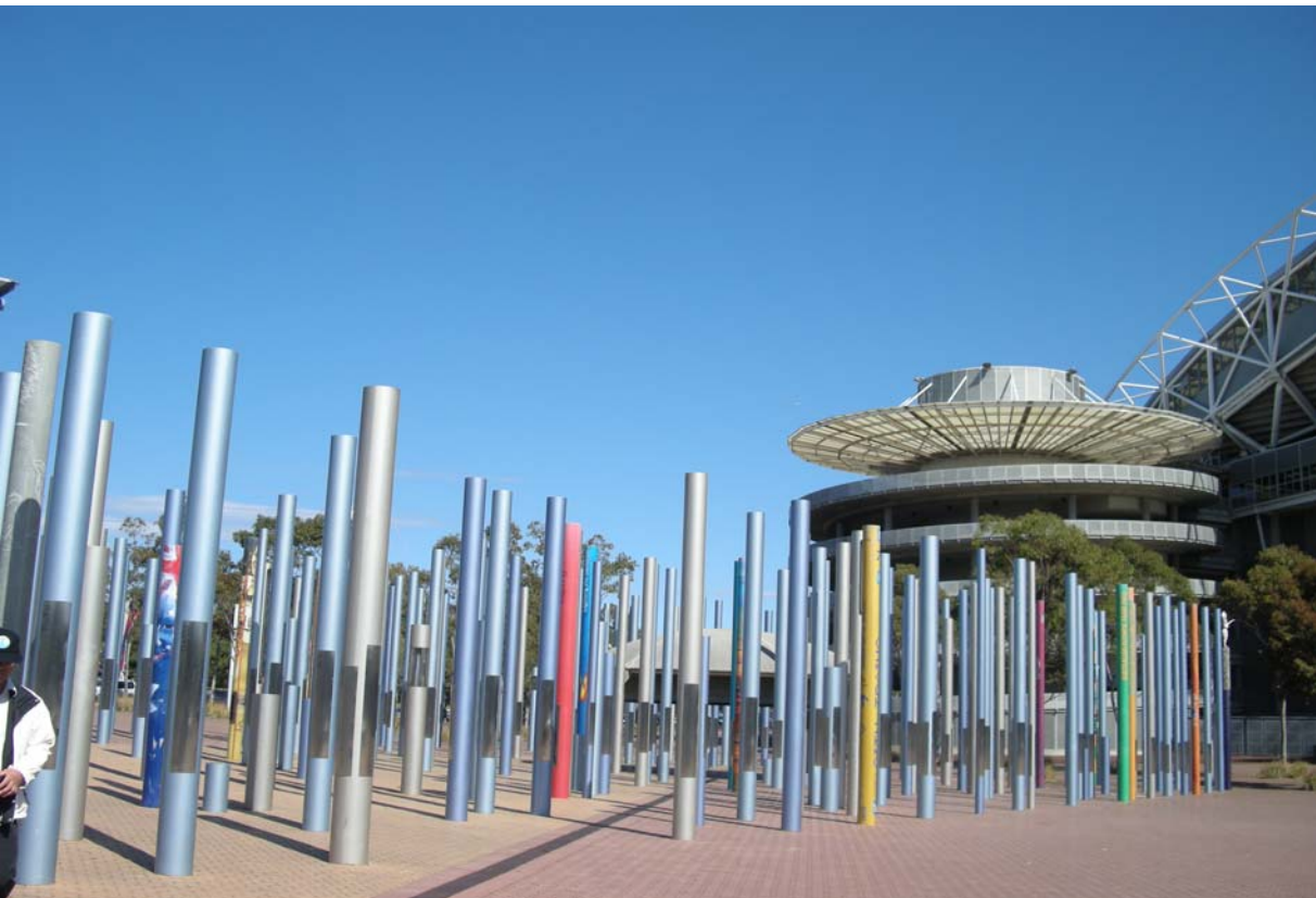
奧林匹克運動公園為志工建置牌柱