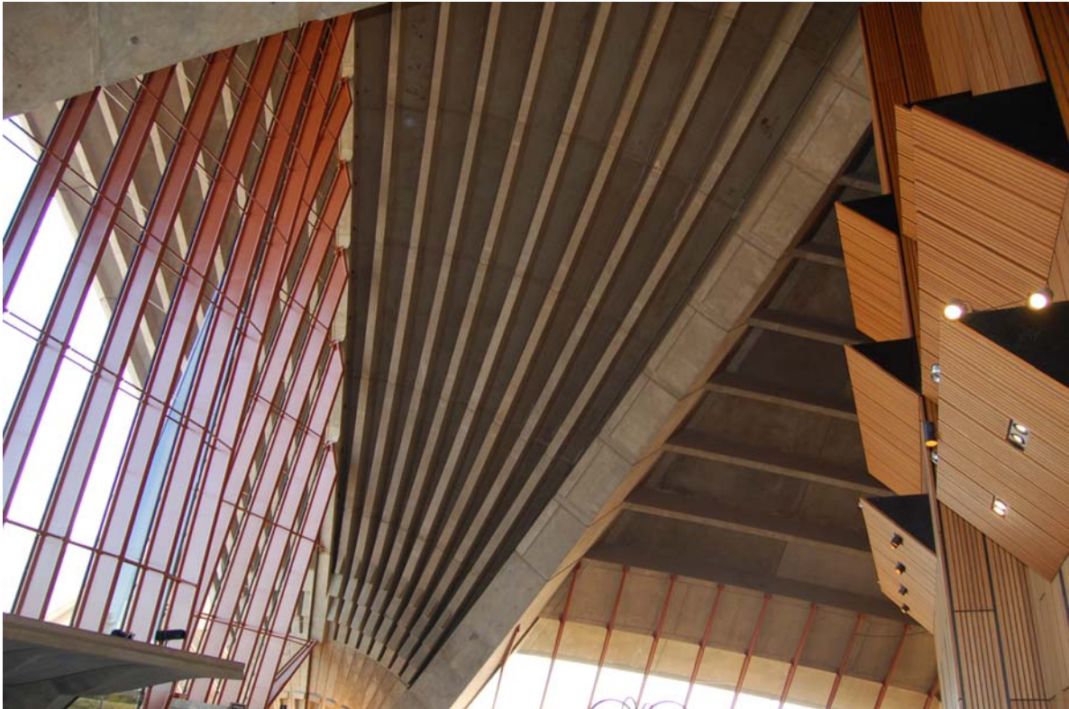
雪梨歌劇院內之結構建築