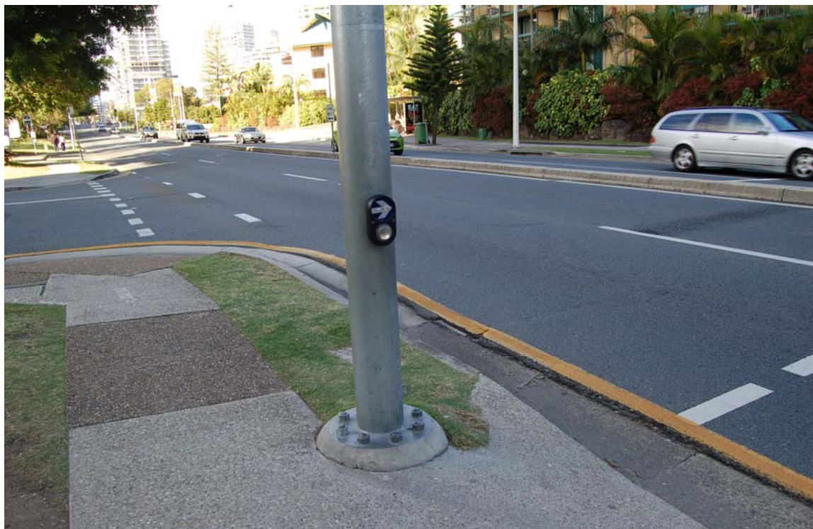
布里斯本穿越馬路時行人觸控號誌燈