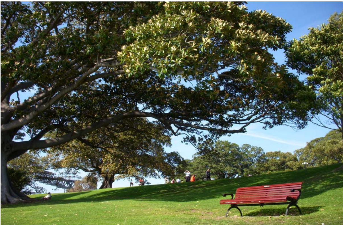
海德公園與麥覺理夫人景觀椅