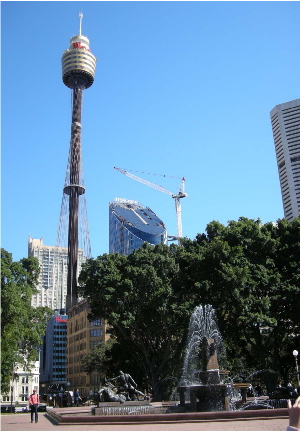
海德公園裡的水池雕像可以看到雪梨另一個著名的地標雪梨塔