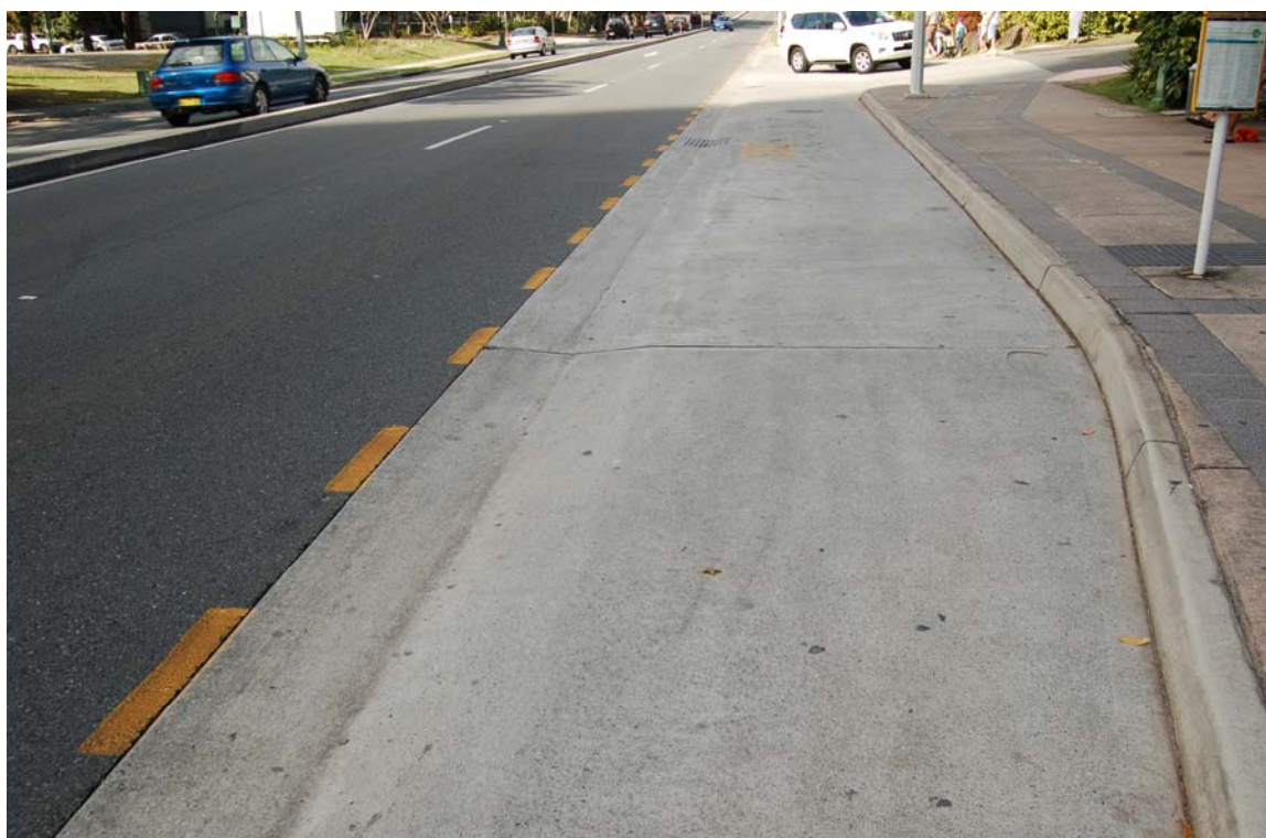
布里斯本馬路與路肩區隔分明