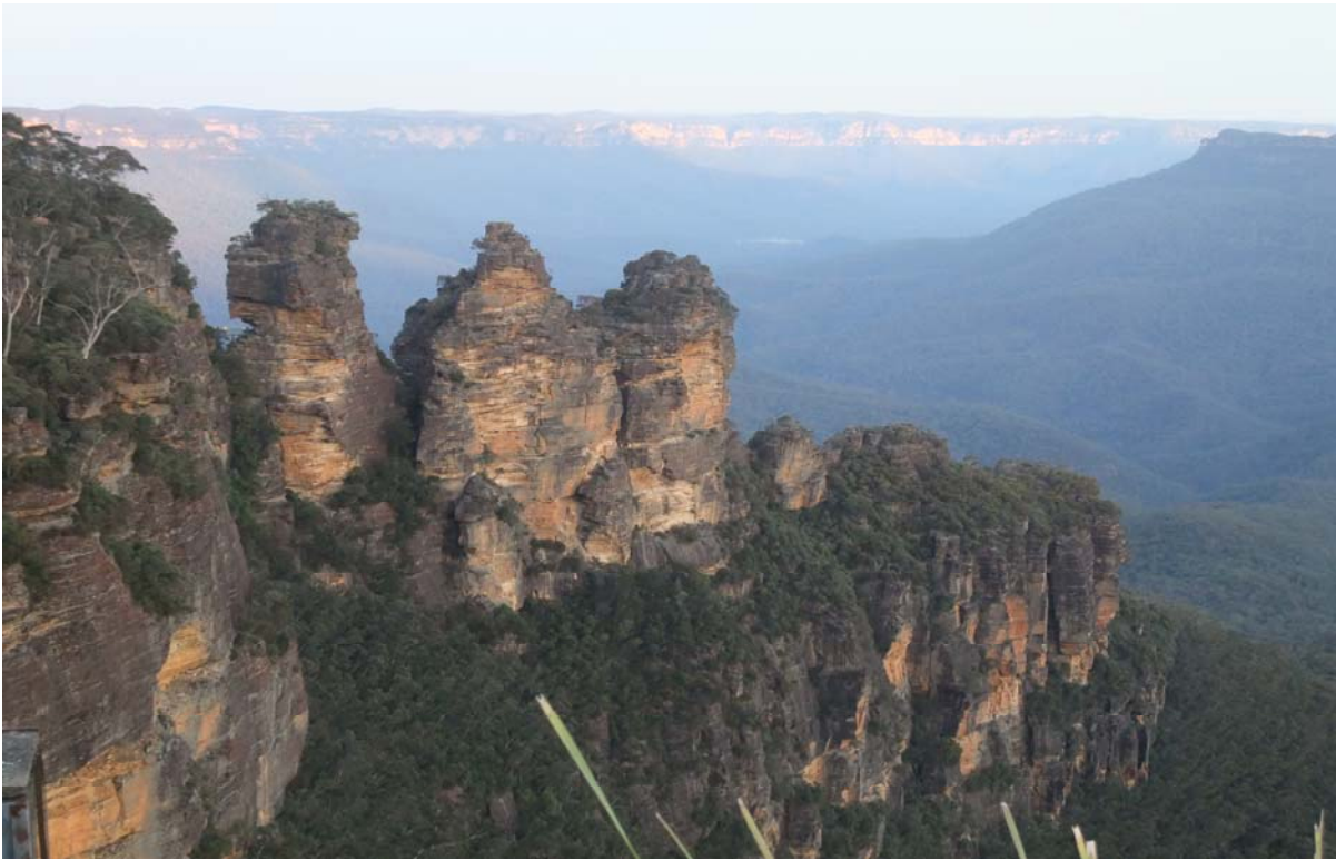
藍山國家公園之三姐妹岩