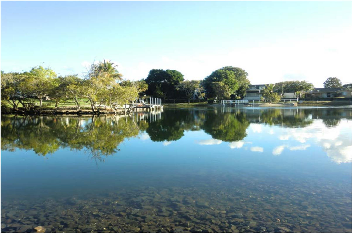
布里斯本蝙蝠公園之美景