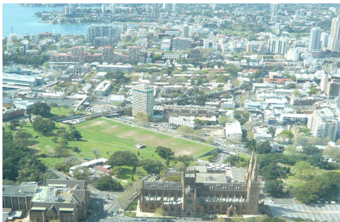
於雪梨塔上眺望雪梨市區景緻