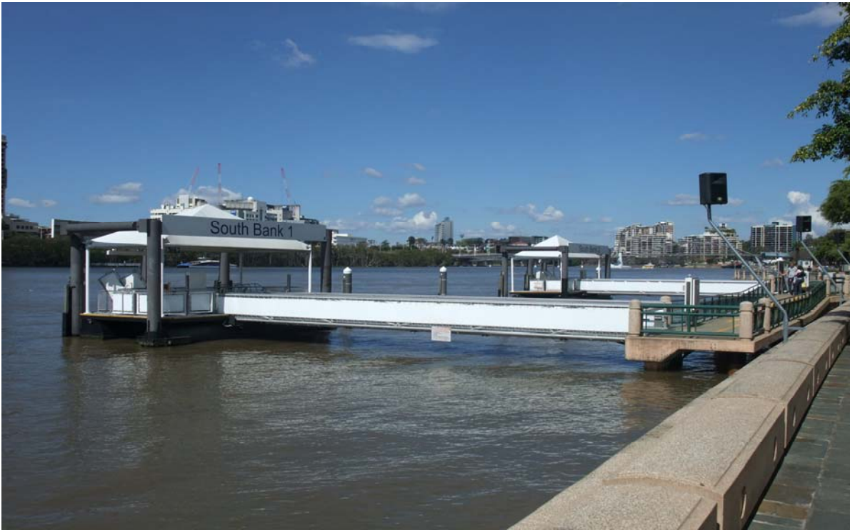
布里斯本之南岸河濱公園浮動碼頭