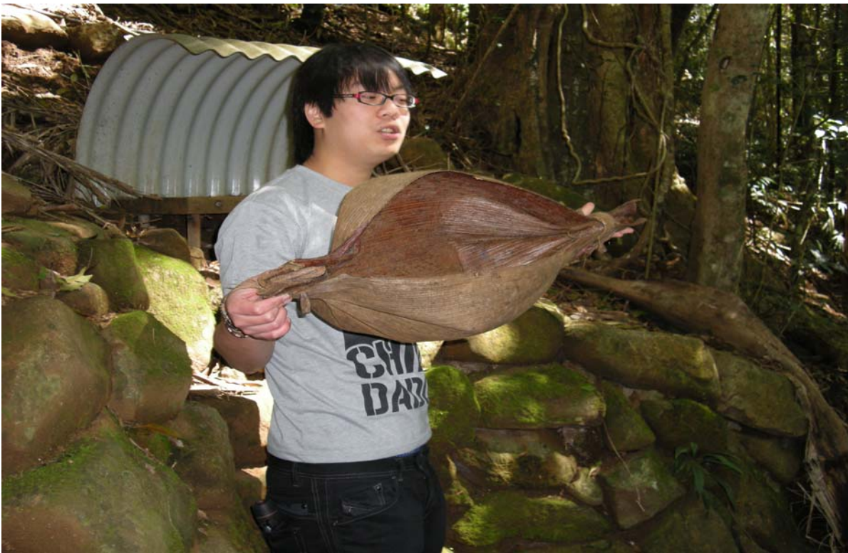
留澳台灣學生於春之泉國家公園講解導覽