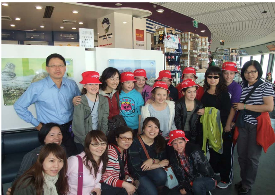
團員於雪梨塔與澳洲學生戶外教學時之合影