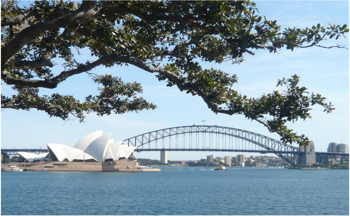
雪梨歌劇院與雪梨大橋之美景