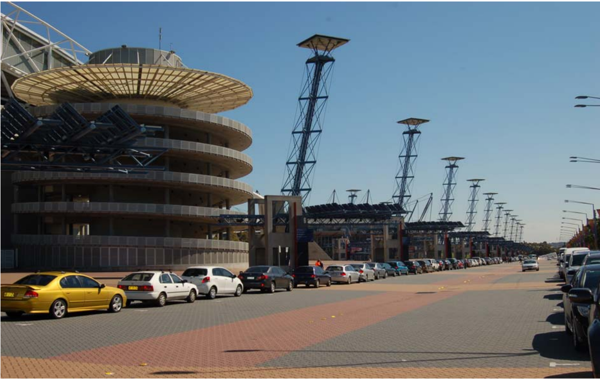
奧林匹克運動公園裝設節能太陽能板