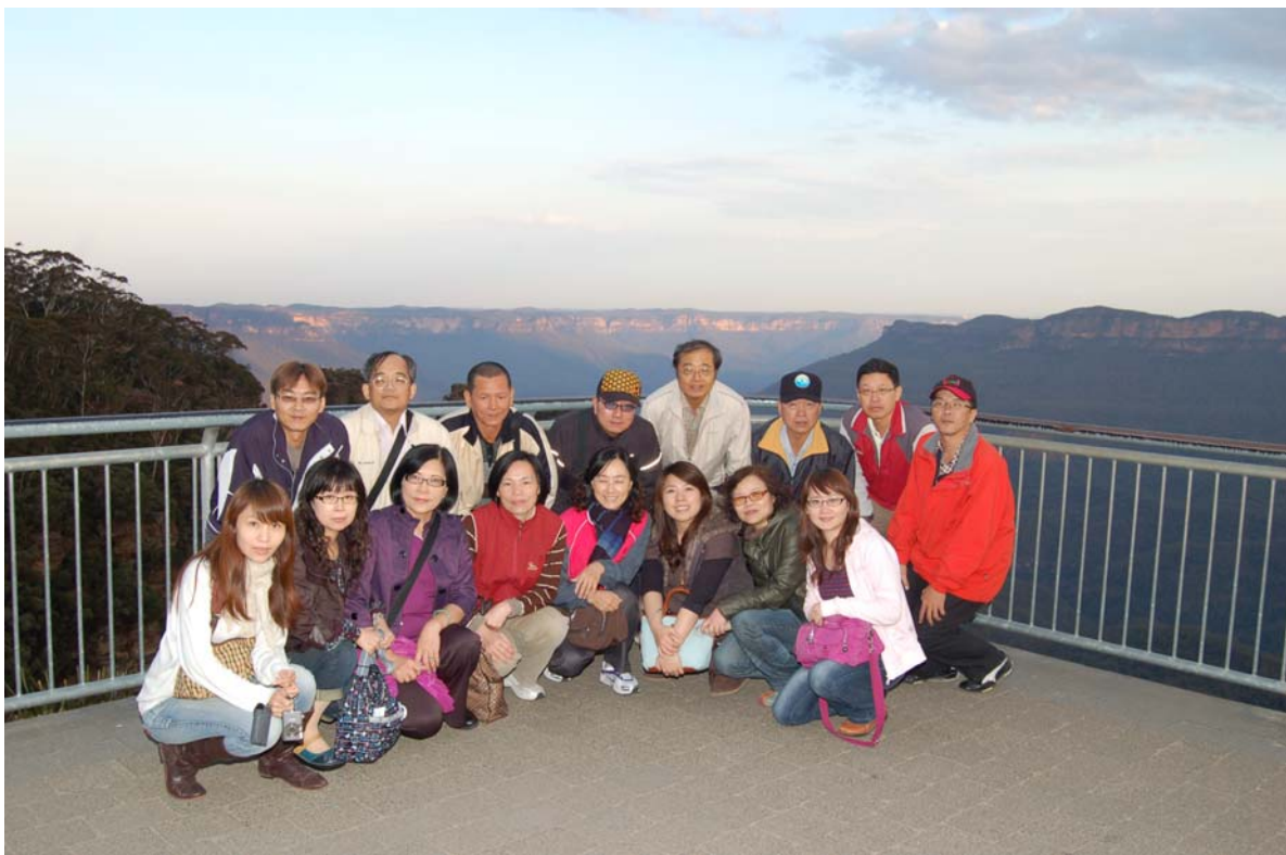
團員於藍山國家公園合影