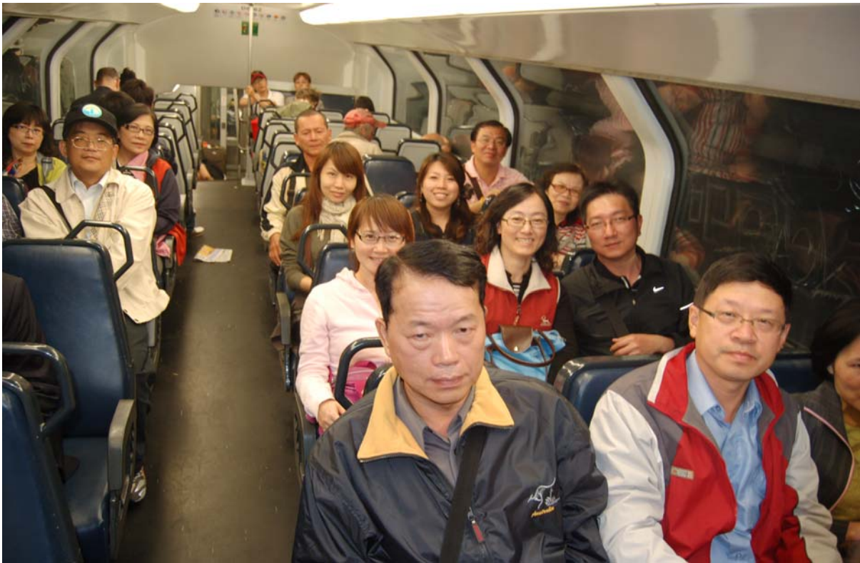
團員於雪梨搭乘雙層車廂地鐵感受上下高度